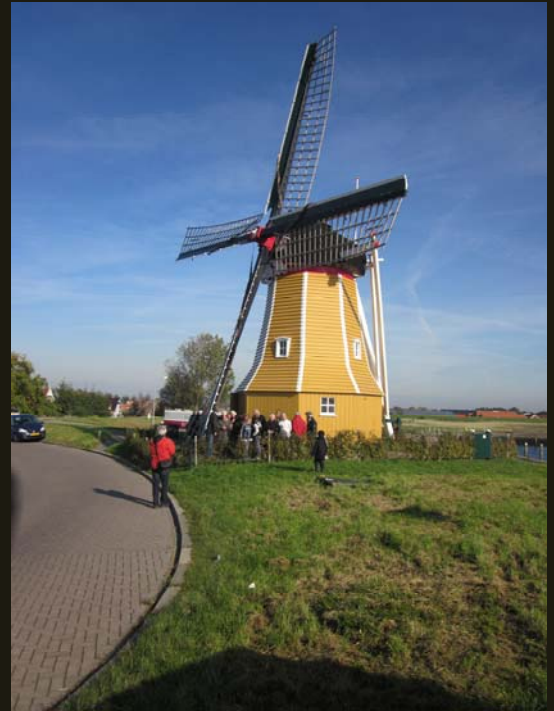
Over de Oostdijk