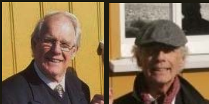
Theo en Ko

Wil je nog reageren op de dag van 21 oktober, doe dat via een mail voor 26 november.