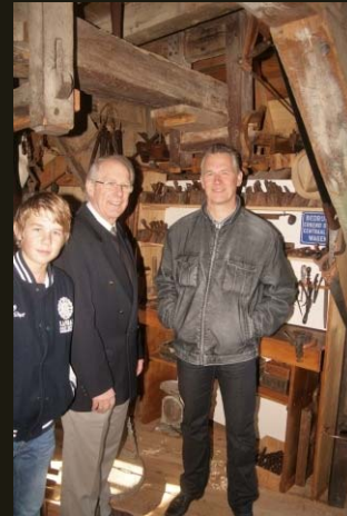
3 generaties van Driel